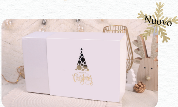
Versione bianca migliorata