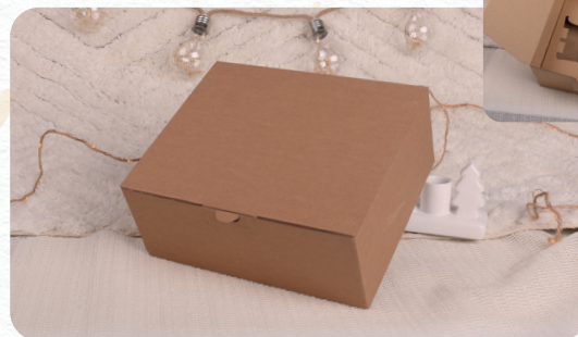
Versione eco standard