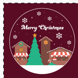
P19 6 colori