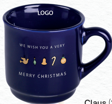
Claus (220 ml) con decorazione P20