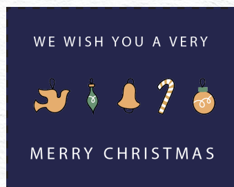
P20 4 colori