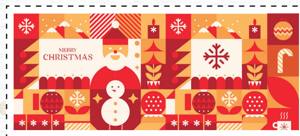
Santa (220 ml) con decorazione P18