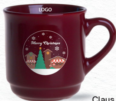
Claus (220 ml) con decorazione P19