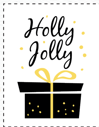
P13 2 colori