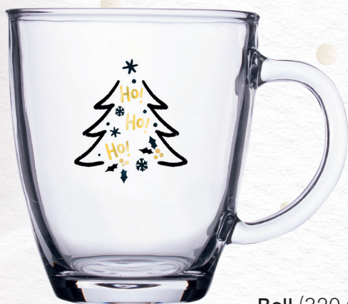
Bell (320 ml) con decorazione P5