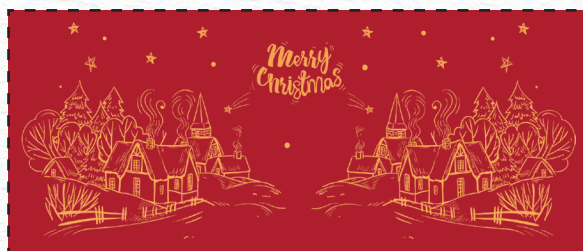
Santa (220 ml) con decorazione P17