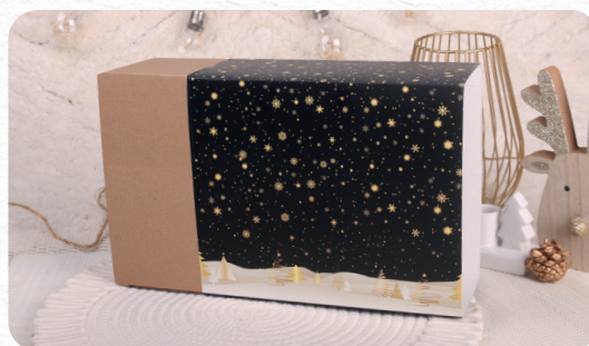
Versione eco standard S2