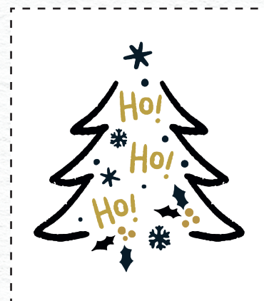
P5 2 colori