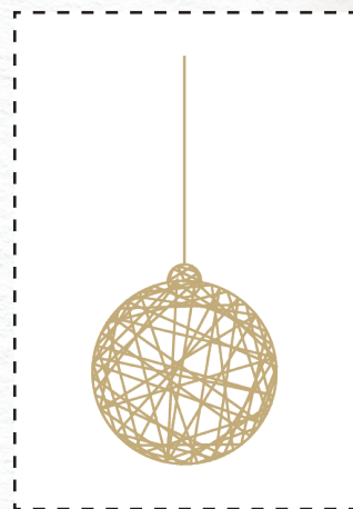
P11 1 colore