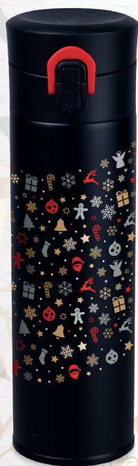
Meteor (320 ml) con decorazione P14