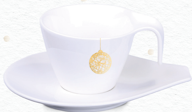
Dream Set (150 ml) con decorazione P11