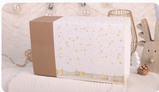
Versione eco standard S1