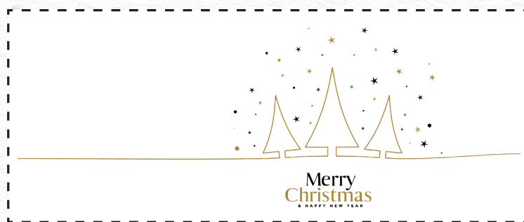
Melody (350 ml) con decorazione P12