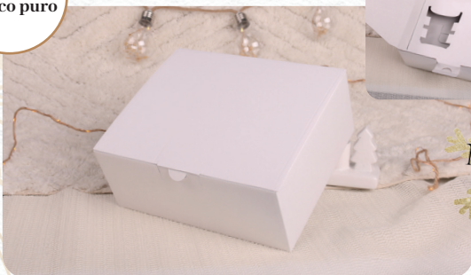
Versione bianca migliorata