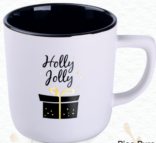
Rico Pure (250 ml) con decorazione P13