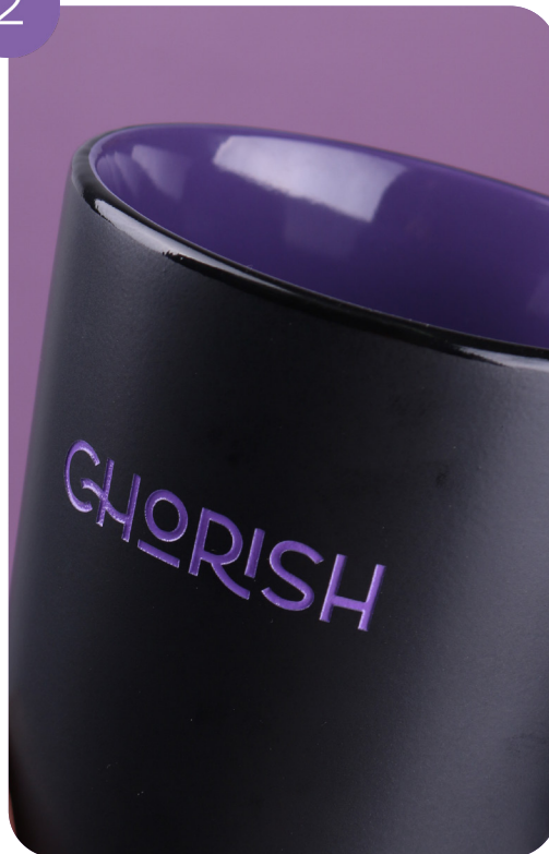
Colorazione interna e sabbiatura (incisione profonda) con riempimento di colore