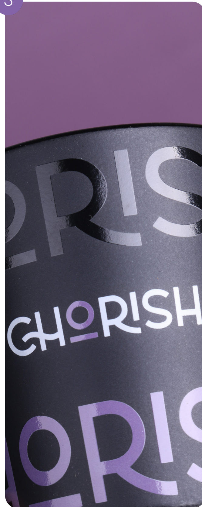
Colorazione interna e stampa di decalcomanie intorno alla tazza (3 colori)