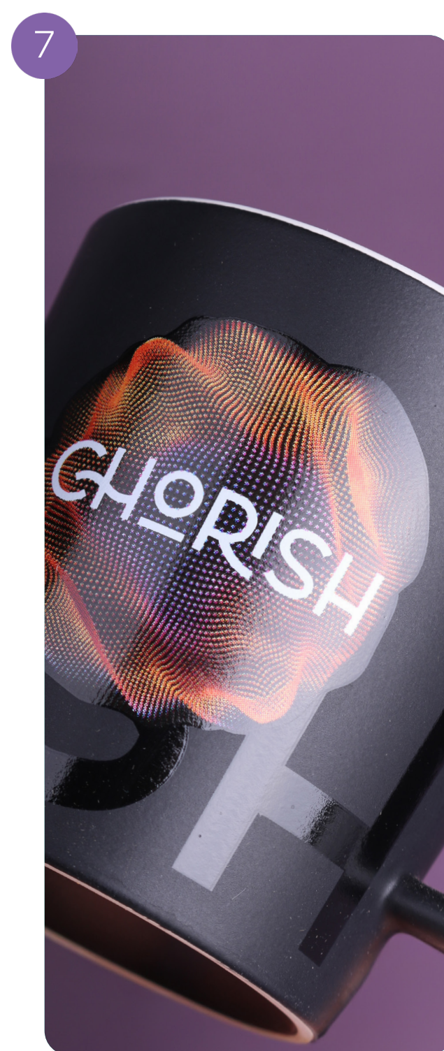
Decorazione con decalcomania organica lungo i bordi (CMYK + 1 colore Pantone)