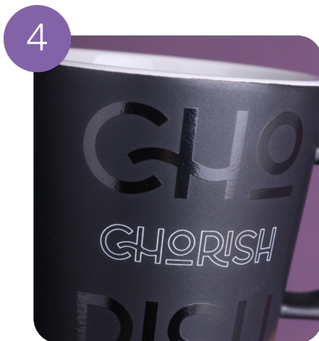
Stampa su un lato (2 colori)