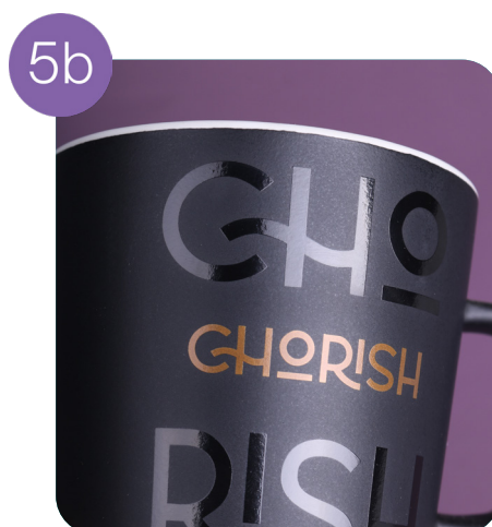
Stampa su un lato (oro + nero)