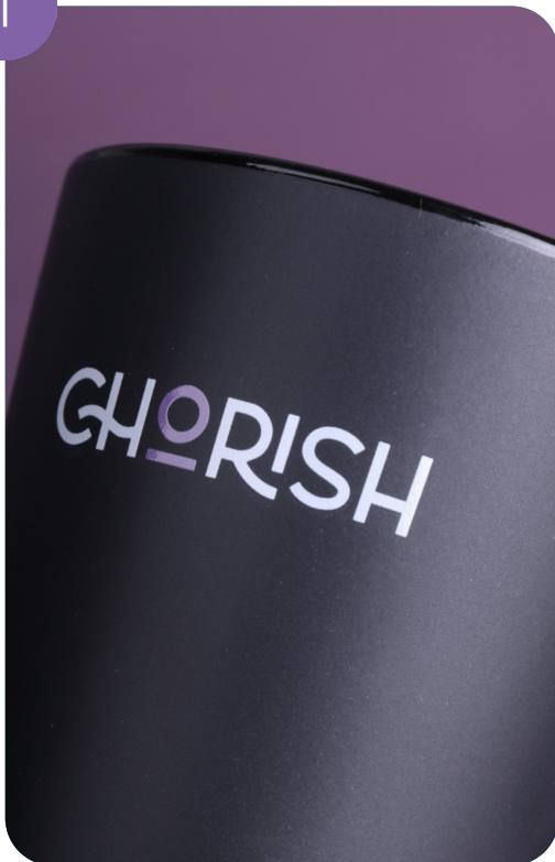
Colorazione interna e stampa su un lato della tazza (2 colori)