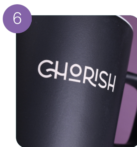
Incisione laser (incisione su lastra*)