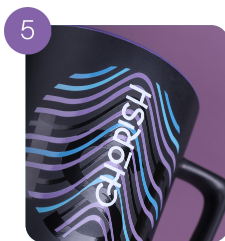
Stampa su tutta la superficie della tazza + realizzata a mano (5 colori)